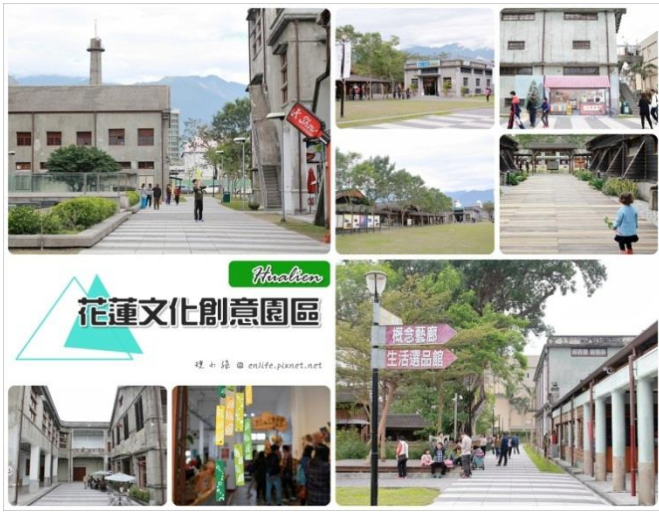
花蓮文化創意產業園區